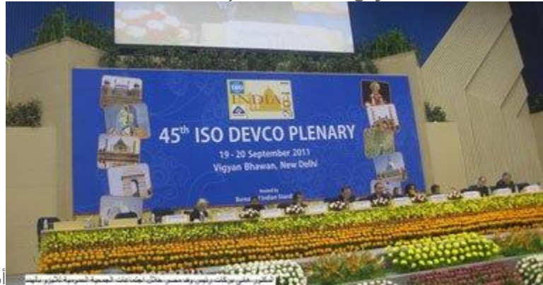
أيزو- صورة أرشيفية